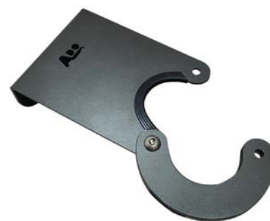
Detalle apertura aparcapatinetes Loner.