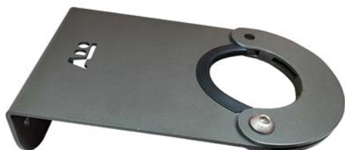
Ref. APLONER G01