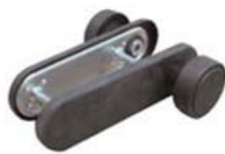
Pomo doble para RF sin agujero bombín. Ref. PDRFSB