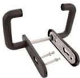
Maneta doble para RF con agujero bombín. Ref. MDRFCB