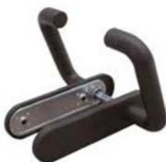
Maneta doble para RF sin agujero bombín. Ref. MDRFSB

ADO, SA. se reserva el derecho a modificar las especificaciones de los productos sin previo aviso.