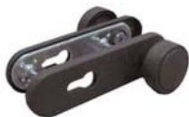
Pomo doble para RF con agujero bombín. Ref. PDRFCB