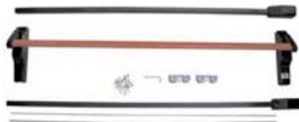
Barra antipánico de 2 puntos.