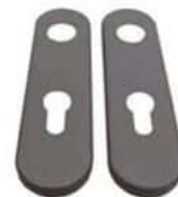
Embellecedor doble RF con bombín. Ref. EDRFCB