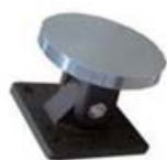
Placa anclaje articulada para electroiman.