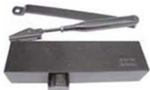
Muelle aéreo con brazo color plata.