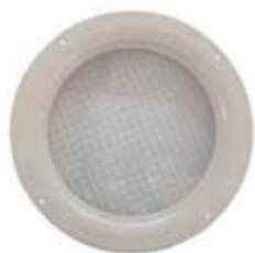
Kit ojo de buey parallamas (no certificado). Ref. POB

Kit ojo de buey cortafuegos (Resistencia al fuego RF-60 con certificado). Ref. POBEI60