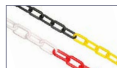
Ref. CP825RB Ref. CP825AN