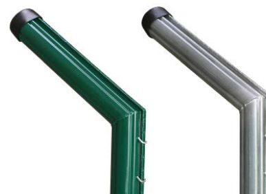
Curvado 50x1.2 mm